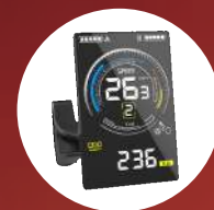
Display LCD a colori