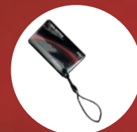
Chiavi con tecnologia NFC